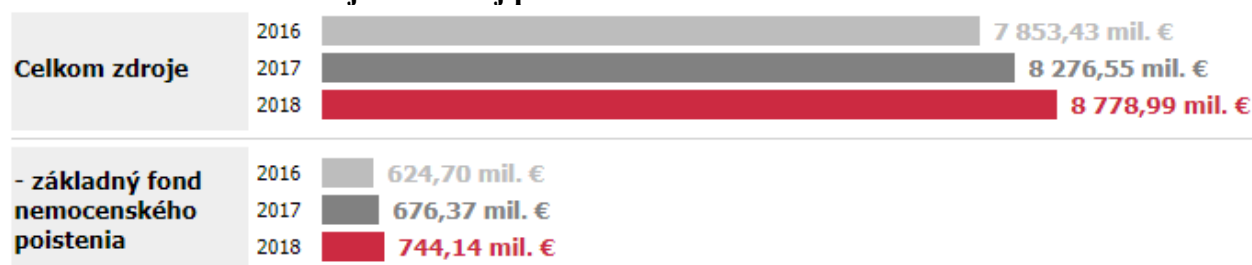
Obrázok 1: Celkové zdroje Sociálnej poisťovne v rokoch 2016-2018

Čo ale možno s určitosťou povedať, narastajúci záujem otcov o poberanie materskej dávky má značný vplyv na rozpočet Sociálnej poisťovne. Nasledujúca časť príspevku sa preto venuje hospodáreniu tejto inštitúcie. Príjmy rozpočtu tvoria predovšetkým príjmy z poistného. Celkové zdroje tvoria základ pre tvorbu základných fondov v rámci sociálneho poistenia.