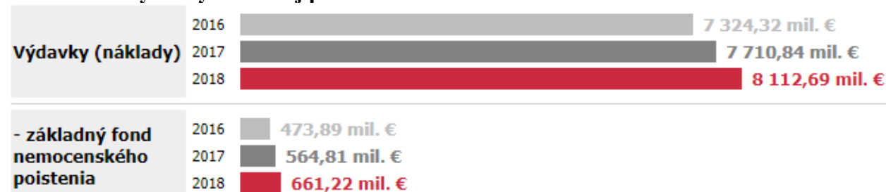
Obrázok 2: Výdavky Sociálnej poisťovne v rokoch 2016-2018

Obrázok 1 znázorňuje celkové príjmy Sociálnej poisťovne zaznamenaných v rokoch 2016 až 2018 so zameraním na základný fond nemocenského poistenia. Každým rokom hospodári s väčším objemom peňazí. V roku 2016 to bolo vyše 7,8 mld. €, v roku 2017 necelých 8,3 mld. € a v roku 2018 vyše 8,7 mld.€. Z týchto zdrojov sa vytvoril základný fond nemocenského poistenia v roku 2016 vo výške vyše 624 mil. €, v roku 676 mil. € a v roku 2018 vyše 744 mil. €. To znamená, že podiel tohto fondu na celkových zdrojoch tvoril v roku 2016 8,0%, v roku 2017 8,2% a v roku 2018 8,5%.